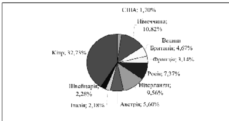
Рис. 3. Структура прямих іноземних інвестицій в економіці України за основними країнами-інвесторами

Оцінка структури основних країн-інвесторів іноземного акціонерного капіталу, які розміщують свої активи в Україні в якості прямих інвестицій показала, що основною країною-інвестором є Кіпр, з великою різницею друге і третє місце посідають Німеччина і Нідерланди.