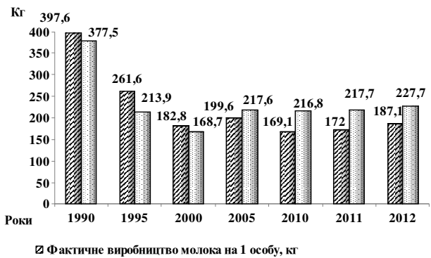
■ Фактичне виробництво молока на 1 особу, кг □ Рівень споживання молока та молочних продуктів на 1 особу у рік, кг

Разом з тим, у контексті даного дослідження, вважається за необхідне проаналізувати і іншу складову ефективності функціонування галузі скотарства у Харківській області, а саме: соціальну ефективність виробництва продукції, котра, на сучасному етапі набуває все більшого значення як для окремого індивіду, так і для суспільства вцілому. Проте, спираючись на положення сучасної економічної літератури, нами досі не було виявлено єдиної системи показників та об'єктивної методики для її визначення.