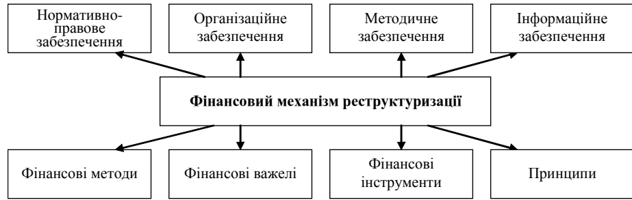
Рис. 2. Фінансовий механізм реструктуризації підприємства

Узагальнюючи вищенаведене можна зробити висновки, що беручи за основу цільовий підхід до класи-