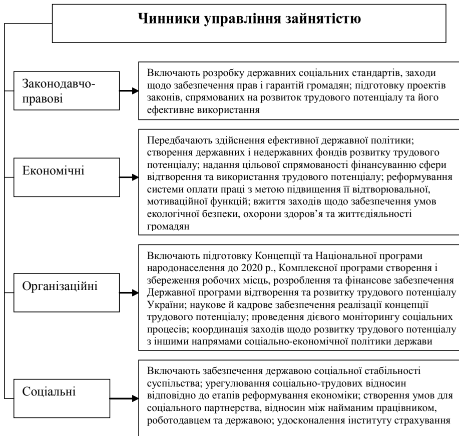
Рис. 3. Чинники управління зайнятістю в Україні

державної стратегії економічної безпеки та політики зайнятості.