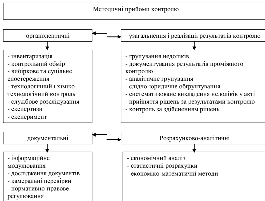
Рис. 4. Власне методичні прийоми контролю за Білухою Н.Т.

Контрольний обмір — порівняння фактично виконаного обсягу робіт з обсягом робіт передбаченим кошторисом, норма-