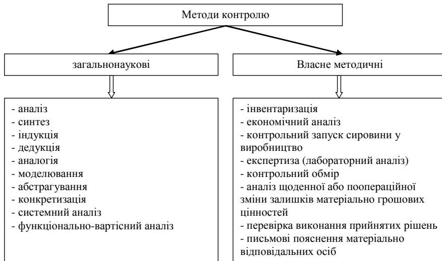
Рис. 3. Розділ методичних прийомів на загальнонаукові і власне методичні

Комбінована перевірка — це поєднання у межах однієї перевірки трьох вищевказаних методичних прийомів організації контролю, тобто суцільного, вибіркового, аналітичного.