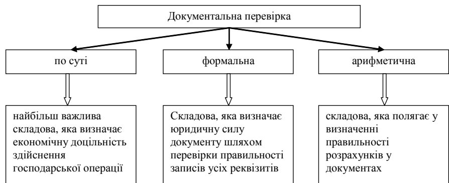
Рис. 2. Способи документальної перевірки

Аналітична перевірка — це оцінка фінансових показників шляхом визначення залежностей між ними.