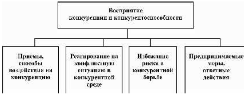
Рис. 1. Восприятие конкуренции и конкурентоспособности