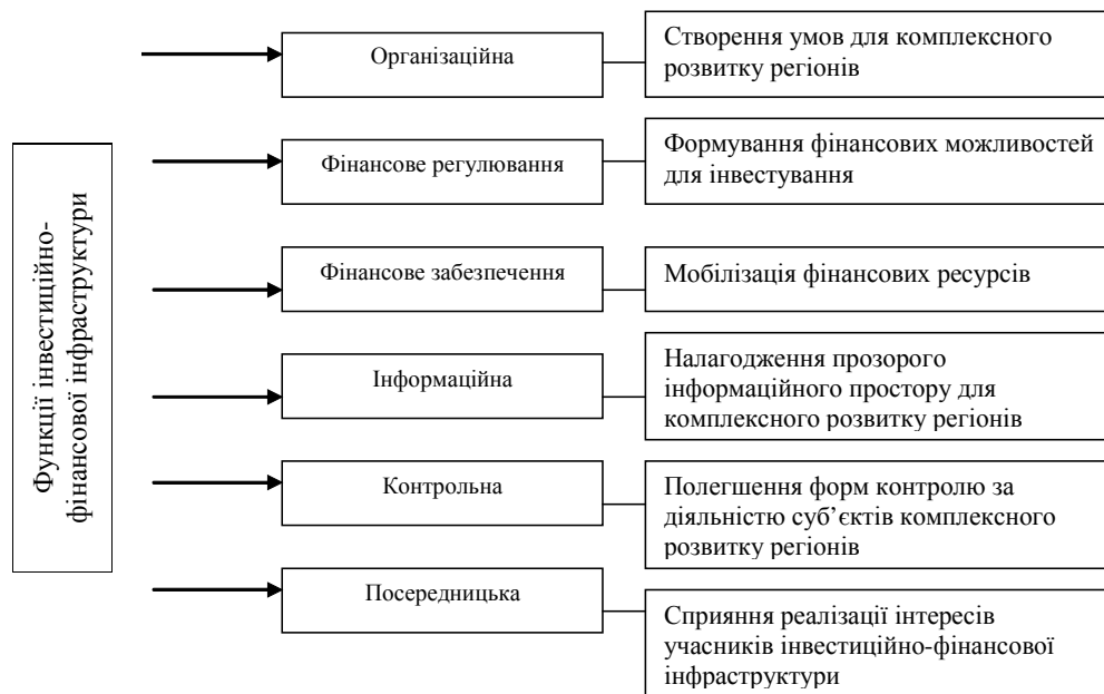
Рис. 2. Базові функції інвестиційно-фінансової інфраструктури