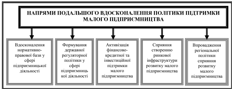
Рис. 2. Напрями вдосконалення підтримки малого підприємництва

Ефективна реалізація державної політики фінансової підтримки малого підприємства має забезпечуватися через використання розвиненої мережі фінансово-кредитних організацій, страхових фірм, інвестиційних і страхових фондів; розвиток і впровадження системи стимулювання комерційних банків та інших фінансових установ, котрі надавали б пільгові кредити малим підприємствам.