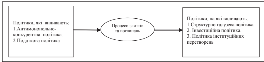
Рис. 1. Процеси злиттів та поглинань в економічній політиці держави