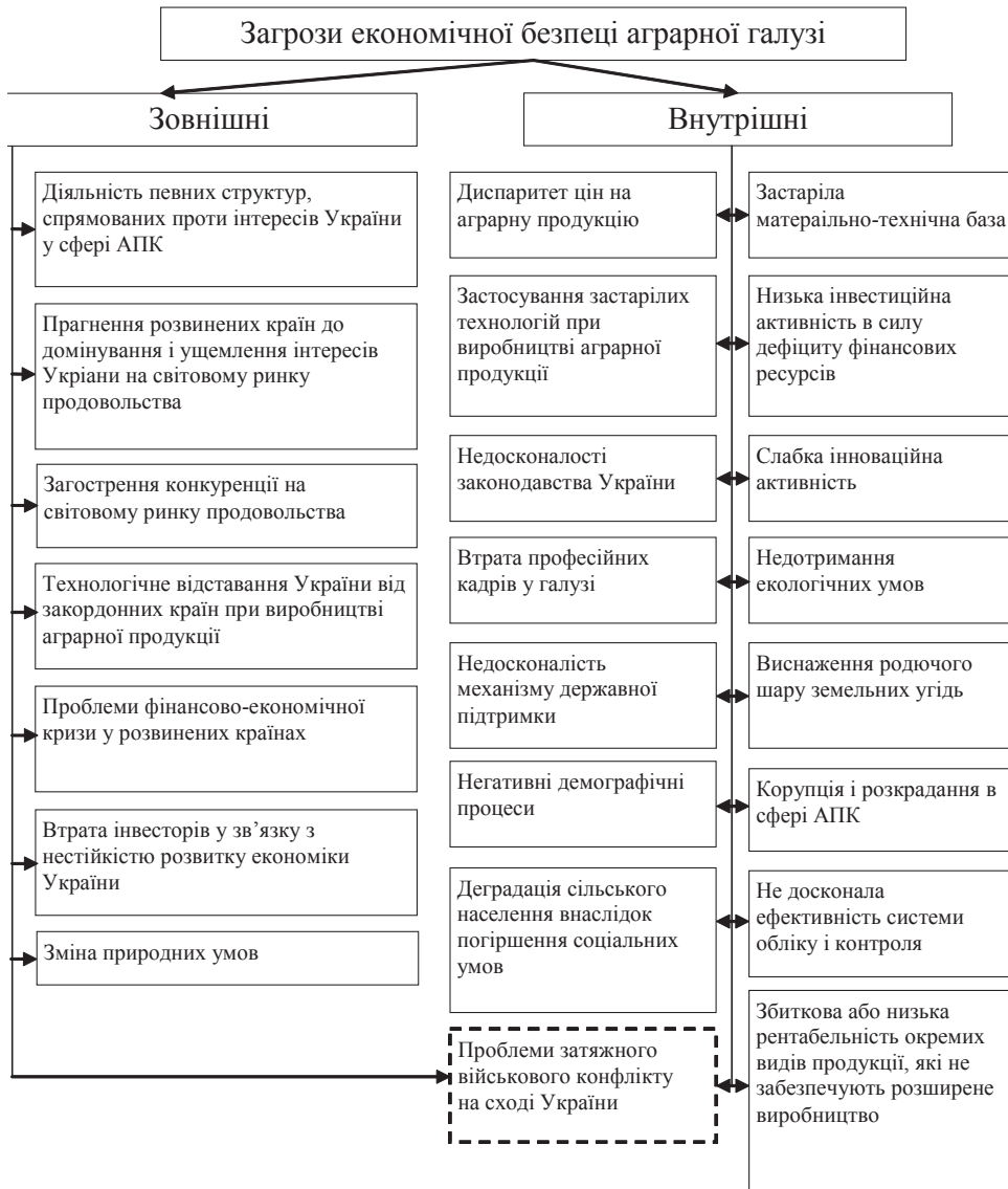
Рис. 1. Загрози економічній безпеці аграрної галузі

ментом є вивчення проблематики дослідження, розробка класифікацій видів безпеки та загроз, а також вивчення особливостей функціонування аграрної галузі.