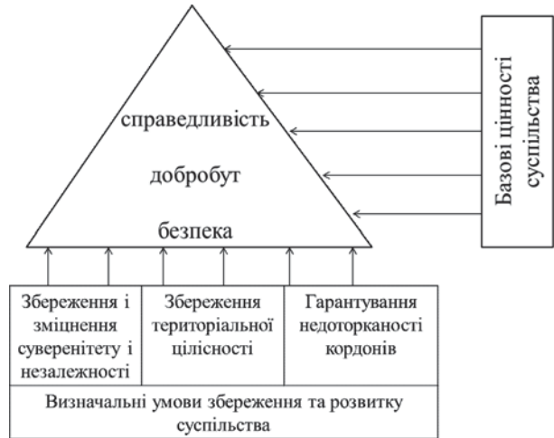
Рис. 1. Цінності суспільства та визначальні умови їх збереження та розвитку

Для цілей нашого дослідження розподілимо базові цінності суспільства на три групи: "безпека", "добробут", "справедливість" (рис. 1), оскільки часто при вирішенні