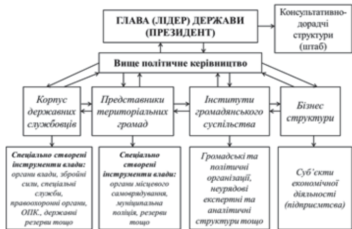
Рис. 3. Принципова схема реалізації місії держави (сучасне уявлення)

Значний інтерес становлять і уявлення про взаємозв'язок держави та безпеки у філософії постмодерну, зокрема, на думку Ж. Бодрійяра сучасна епоха є ерою гіперреальності, коли надбудова визначає базис, а її останнім bastionом є смерть, яка не має споживчої вартості, але саме на ній базується будь-яка влада та економіка [19]. З огляду на це, на думку вченого, влада сама здійснює виробництво безпеки: починаючи від воєнної безпеки і закінчуючи страхуванням від нещасного випадку на виробництві. При цьому, у будь-якому разі йдеться фактично про конвертацію смерті, нещасного випадку, хвороби тощо в капіталістичний надприбуток. Ж. Бодрійяра убачає у такій еволюції поняття безпеки природний розвиток логічних передумов, що містилися в теорії "суспільного договору", де влада наділяється правом змусити померти і дозволити жити, але через симетрію з'являється нове право: право змусити жити і дозволити померти, тобто проявляється сутність та мета влади, а саме: контролювати життя як таке. Такі погляди на владу у філософії постмодерна зумовлюють й відповідні трансформації уявлень про сутність безпеки та інститутів держави. З одного боку, інститути зорієнтовані на захист громадян від тероризму, збитків, безробіття тощо, тобто гарантії індивідуальної безпеки розширюються, але водночас розширюється сфера контролю та можливостей влади, через що така "турбота" влади щодо безпеки громадян стає загрозою для них 6 .