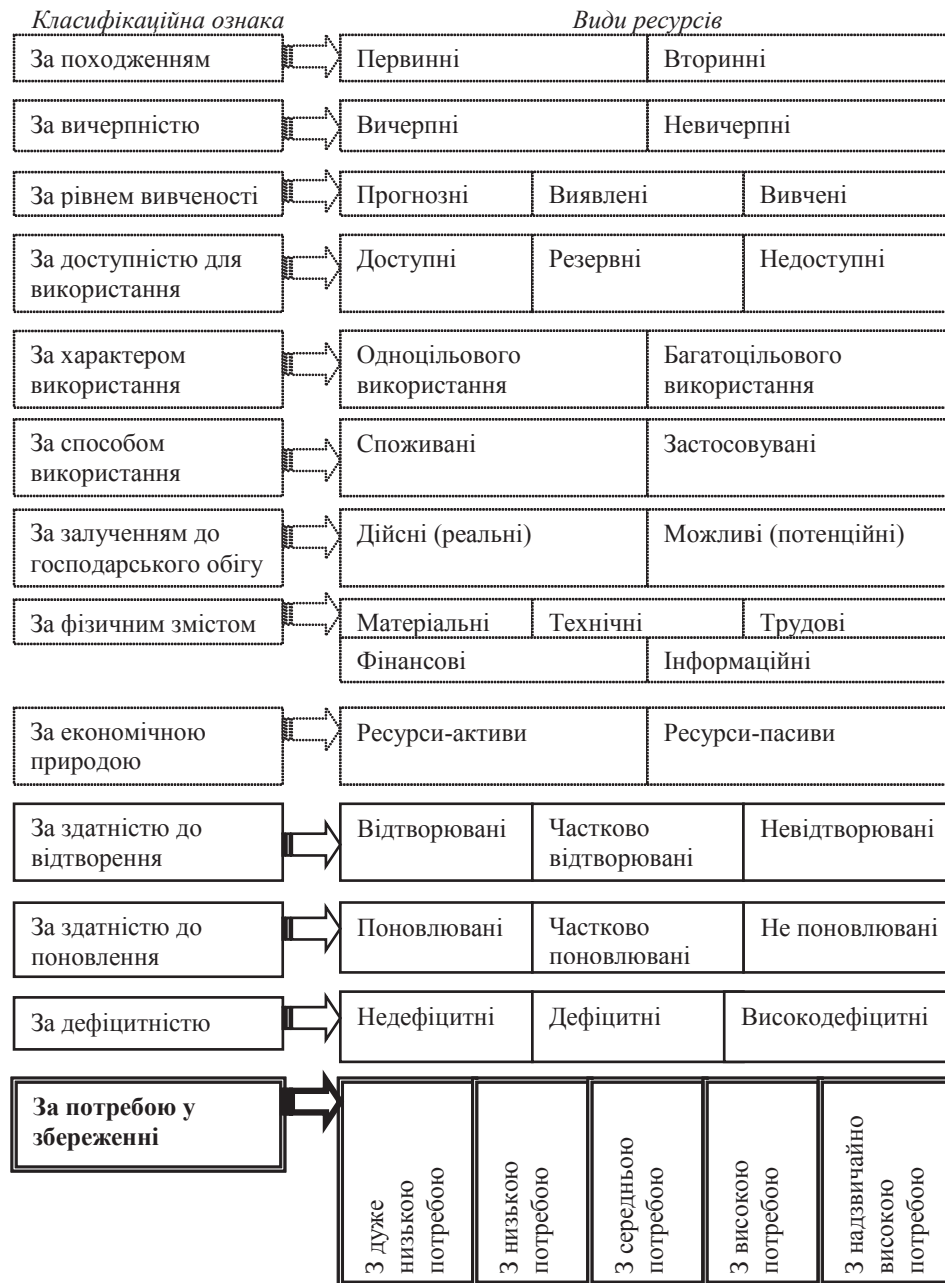
Рис. 2. Класифікація ресурсів національного господарства

нансових, енергетичних, технічних засобів та робочої сили. Тобто прибічники цього підходу, а саме: Беляєв М.І., Березной І.Г., Маргелов В.Н., Петров Г.А., Семенов В.І. [9, с. 86] розглядають термін "ресурси", здійснюючи їх декомпозицію на складові частини, що дозволяє охарактеризувати структуру ресурсів та визначити елементи, що входять до їх складу. Водночас, даний підхід скоріше сприяє визначенню видів ресурсів, а не розумінню сутності цього поняття.