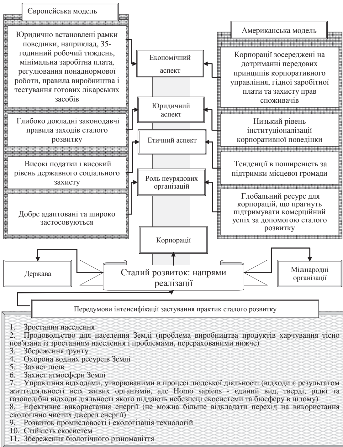
Рис. 2. Систематизація параметрів Американської та Європейської моделей поведінки корпорацій в ході реалізації принципів сталого розвитку