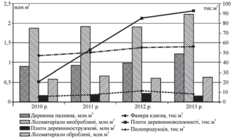
Рис. 2 Порівняльний аналіз товарної структури експорту деревообробного виробництва України

Як свідчать дані наведені на рисунку 2, експорт необробленої деревини постійно зростає з 2776,7 тис. м 3 у 2010 р. до 3447,0 тис. м 3 у 2013 р. [1], тобто за три останні роки експорт необроблених лісоматеріалів зріс на 29,6 %. Водночас оброблені лісоматеріали та пилопродукція практично не збільшили експорту. На постійному рівні перебуває і експорт плитних матеріалів та фанери. У 2013 році експорт ДСП значно скоротився з 220 тис. м 3 в 2012 році до 165,2 тис. м 3 в 2013 році. ДВП та фанера дещо наростили обсяги експорту і в 2013 р. становили відповідно 92,7 та 56,4 тис. м 3 [1].