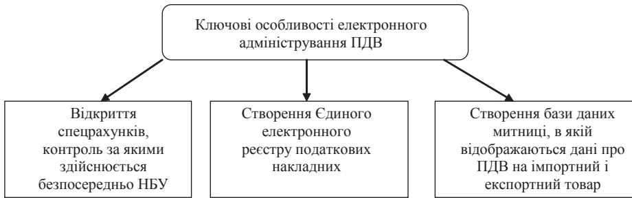
Рис. 1. Ключові особливості електронного адміністрування ПДВ в Україні

Дослідження запроваджених реформ з ПДВ на рівні підприємства свідчать, що перед більшістю промисловців постала проблема відволікання обігових коштів, що зумовлено введенням норм електронного адміністрування ПДВ, внаслідок чого вони стикаються з скороченням обсягів виробництва, зниженням розмірів прибутку, з неможливістю своєчасно розрахуватися з поставачальниками та кредиторами, що призводить до кризи підприємств і навіть цілих галузей.