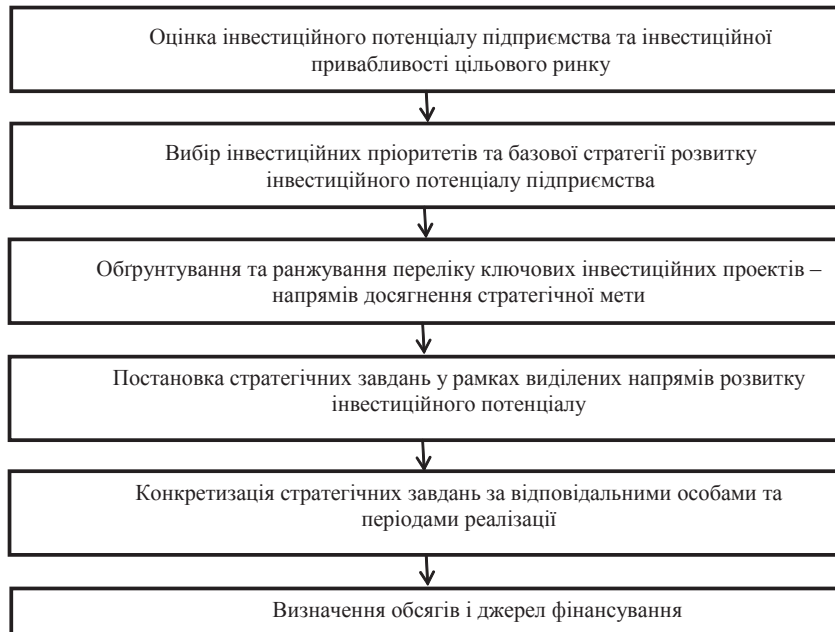
Рис. 2. Етапи розробки сценарію формування та реалізації інвестиційного потенціалу підприємства

На нашу думку, формування інвестиційного потенціалу (тобто створення нових інвестиційних можливостей) відбувається під впливом продуктивних та лімітуючих факторів. Продуктивні фактори дають змогу підвищити ефективність господарської діяльності підприємства у результаті інвестування, а лімітуючі фактори унеможливають миттєву реалізацію інвестиційного потенціалу сприяють накопиченню інвестиційних можливостей. Підприємство приймає рішення щодо доцільності інвестування та обирає інвестиційну стратегію із урахуванням співвідношення продуктивних та лімітуючих факторів.