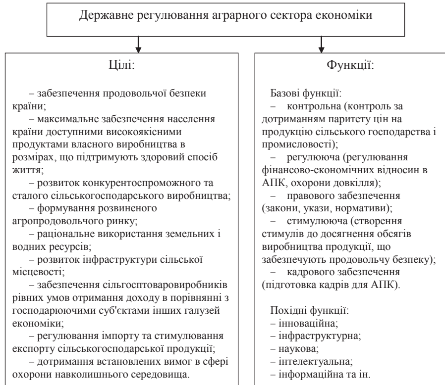
Рис. 2. Цілі та функції державного регулювання аграрного сектора економіки

1. Васильєва Л.М. Об'єктивна необхідність дер-жавного регулювання аграрного сектора економіки /