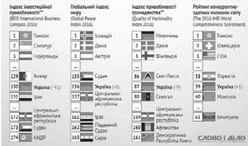
Рис. 1. Україна у світових рейтингах