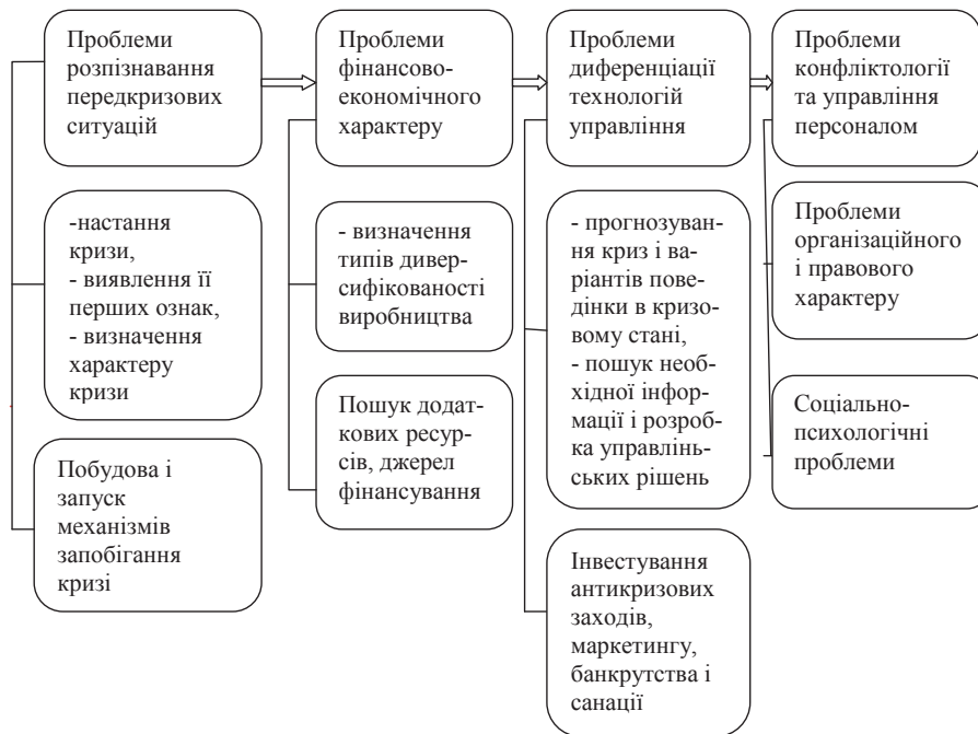
Рис. 3. Групи проблем антикризового управління на підприємствах та їх рішення

Антикризове управління складом своїх типових проблем відбиває ту обставину, що воно є особливим типом управління, яке володіє як загальними для управління рисами, так і неспецифічними його характеристиками. Можливість антикризового управління визначається в першу чергу людським фактором. Усвідомлена діяльність людини дозволяє шукати і знаходити шляхи виходу з критичних ситуацій, концентрувати зусилля на вирішенні найбільш складних проблем, використо-