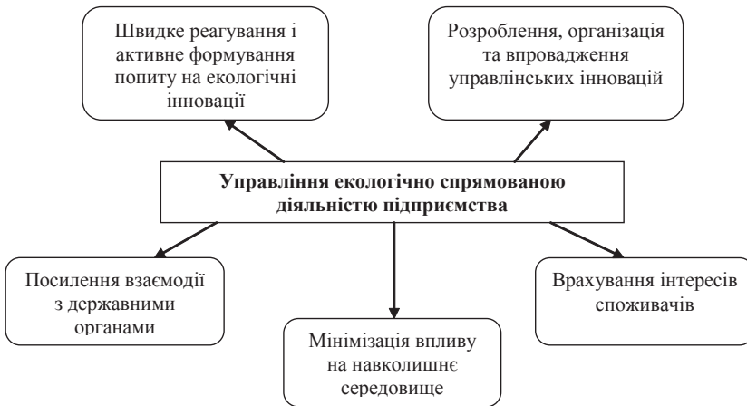
Рис. 1. Управління екологічно спрямованою діяльністю підприємства