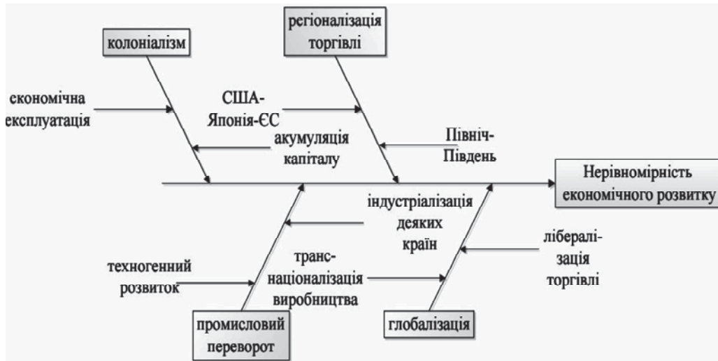
Рис. 1. Причинно-наслідкова діаграма Ісакави щодо проблеми нерівномірності економічного розвитку