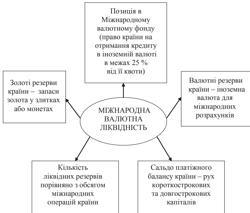
Рис. 4. Складові міжнародної валютної ліквідності країни