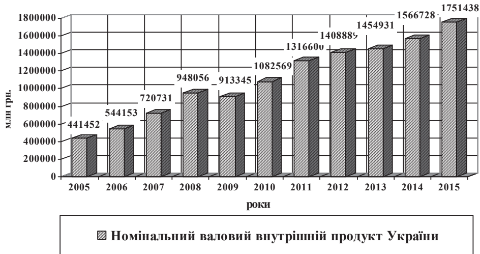
Рис. 2. Номінальний валовий внутрішній продукт України за 2005—2015 роки, млн грн.