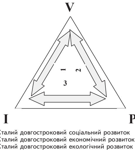
Рис. 1. Трикутник стратегічних пріоритетів економічних реформ Польщі

Другою стратегічною "вершиною" програми економічних реформ визначались "інститути", які реалізують європейський вектор та забезпечують збереження цінностей.