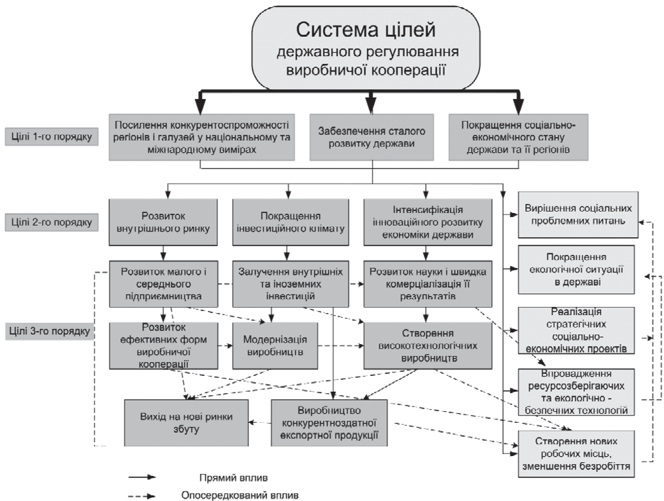
Рис. 2. Система цілей державного регулювання виробничої кооперації в Україні