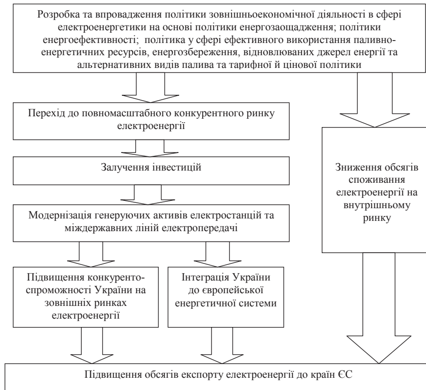
Рис. 2. Модель структурних перетворень державного регулювання в сфері електроенергетики

— запропонувати механізм державного регулювання зовнішньоекономічної діяльності в сфері електроенергетики;