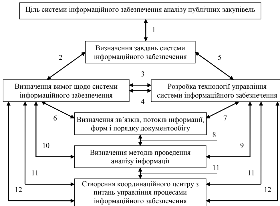
Рис. 2. Формування системи інформаційного забезпечення аналізу публічних закупівель

ління системою інформаційного забезпечення повинні бути взаємна відповідність та взаємозв'язки.