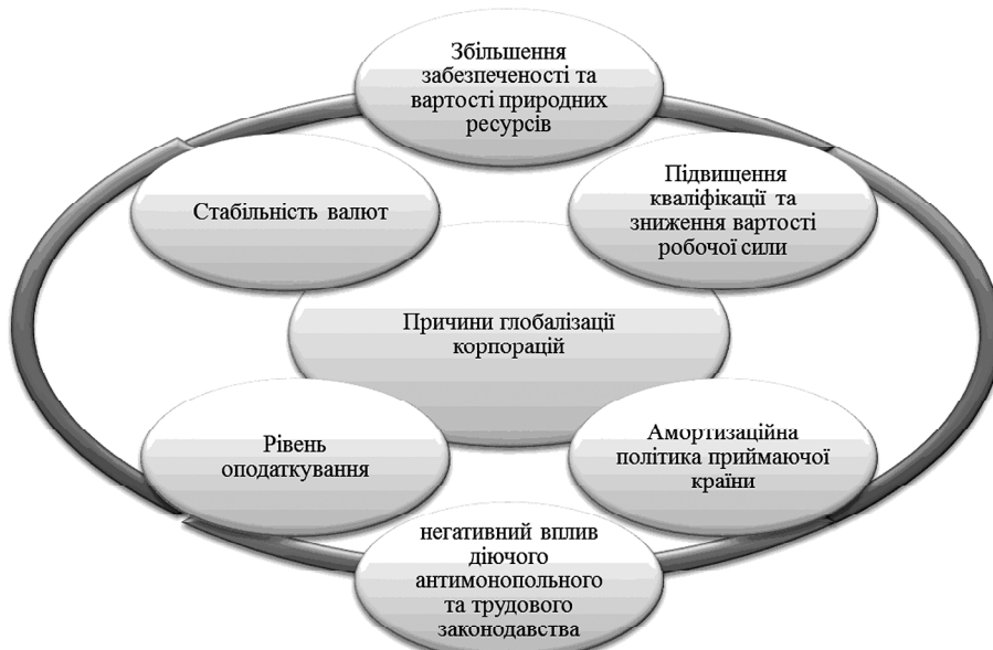
Рис. 1. Базисні виміри розвитку та глобалізації діяльності корпорацій