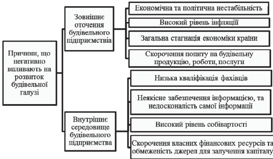
Рис. 2. Основні причини, що перешкоджають стабілізації та подальшому розвитку будівельного комплексу країни

відбувається у зв'язку з високими ризиками, що супроводжують будівництво. Так, на протязі 2014—2015 років індекс капітальних інвестицій в будівництві складає 80%, тобто, за два роки фінансування скоротилося майже на 40% [7]. Перелічені фактори значно впливають на фінансову стійкість та ліквідність будівельних підприємств, що, в свою чергу, призводить їх стан до банкрутства.