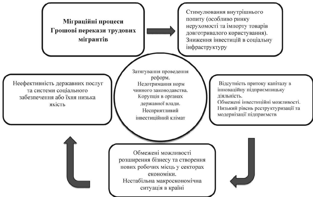
Рис. 2. Економічна "пастка" неефективного використання грошових переказів трудових мігрантів