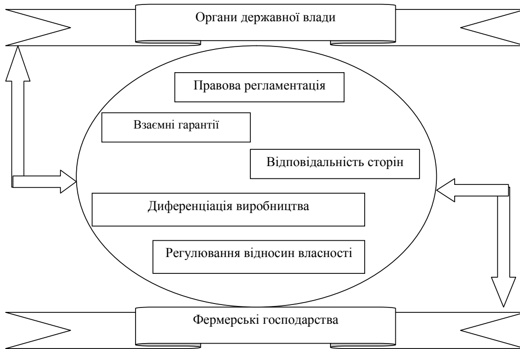
Рис. 1. Механізм взаємодії органів влади і фермерських господарств