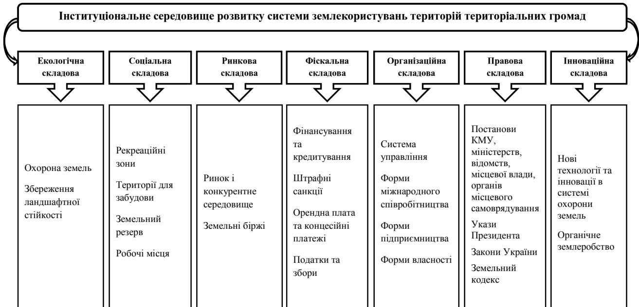
Рис. 1. Перспективна модель інституціонального середовища розвитку системи землекористувань територій територіальних громад