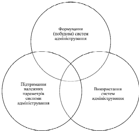
Рис. 2. Ключові напрями управління системами адміністрування в організаціях