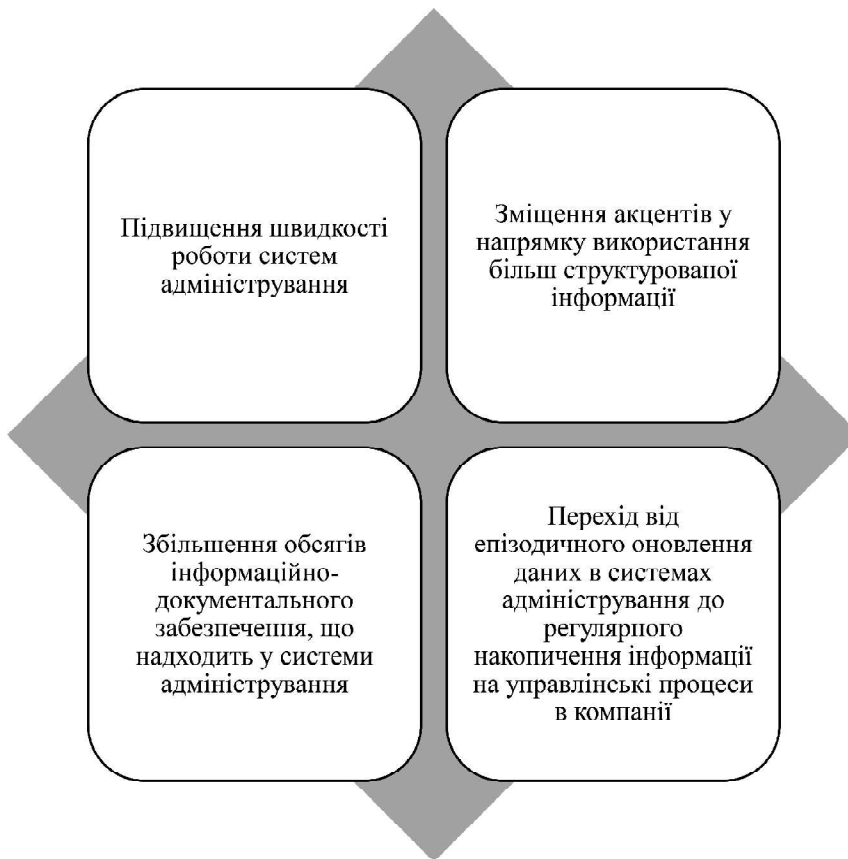
Рис. 1. Основні напрями подальшого розвитку систем адміністрування в управлінні підприємствами