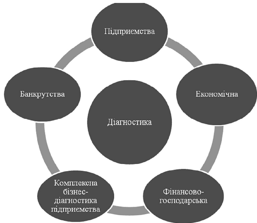
Рис. 1. Види діагностики

Крім того, в сучасних економічних умовах надзвичайно актуальною є своєчасна, повна та об'єктивна діагностика економічної безпеки держави інструментами державного управління. Це дозволяє оперативно виявляти загрози і небезпеки та використовувати адекватний інструментарій мінімізації їх впливу, планувати та реалізовувати механізм захисту держави від небезпек і загроз та, в свою чергу, оптимізувати і систематизувати роботу всієї національної економіки.