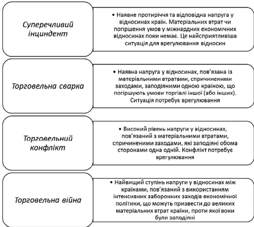
Рис. 1. Стадії виникнення конфліктів у міжнародних економічних відносинах

суб'єктами господарювання, і торгово-політичні — виникають між державами у зв'язку з питань регулювання і обмеження зовнішньоекономічних операцій, а також між державами і окремими суб'єктами господарювання, зокрема, коли уряд певної країни виступає проти недобросовісної комерційної практики фірм або намагається під цим приводом обмежити імпорт. Кожен контрагент прагне до забезпечення найбільш сприятливих комерційних умов, нерідко навіть на шкоду комерційного партнера, а уряди відстоюють інтереси вітчизняних виробників усіма доступними їм засобами, в тому числі і не завжди достатньо обґрунтованими. Тому розвиток міжнародних економічних відносин в ХХ ст. супроводжується інтенсивними пошуками світовою спільнотою шляхів скорочення кількості та ефективного врегулювання спорів, що виникають як між безпосередніми учасниками зовнішньоекономічних угод, так і між державами.