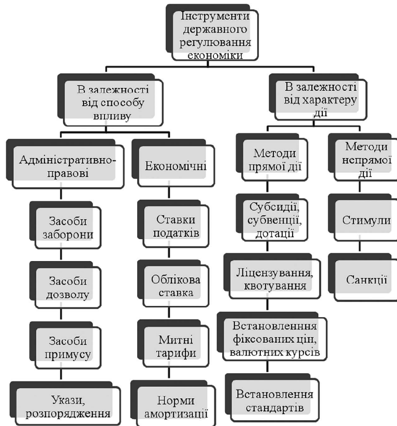
Рис. 2. Інструменти державного регулювання економіки

З рисунка 2 ми можемо побачити, що інструменти державного регулювання економіки поділяються на: