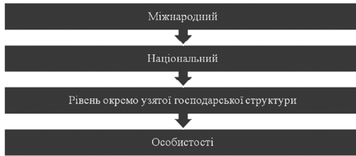
Рис. 1. Основні рівні економічної безпеки держави