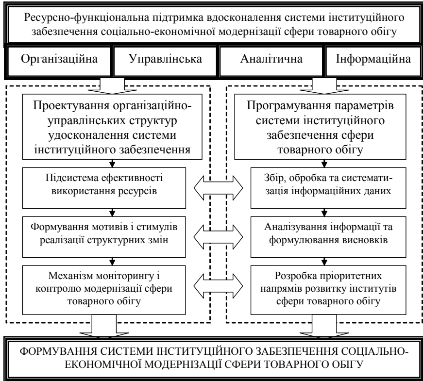
Рис. 1. Модель ресурсно-функціональної підтримки вдосконалення системи інституційного забезпечення соціально-економічної модернізації сфери товарного обігу

Очевидно, що структурно-функціональна розбалансованість і недостатня ефективність функціонування