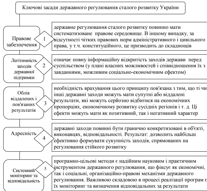
Рис. 2. Ключові засади державного регулювання сталого розвитку України

— державні секторальні / галузеві стратегії, які повинні сприяти реалізації встановлених стратегічних цілей; вони уточнюють напрямок дій, реформ, і визначають інструменти виконання державних завдань;