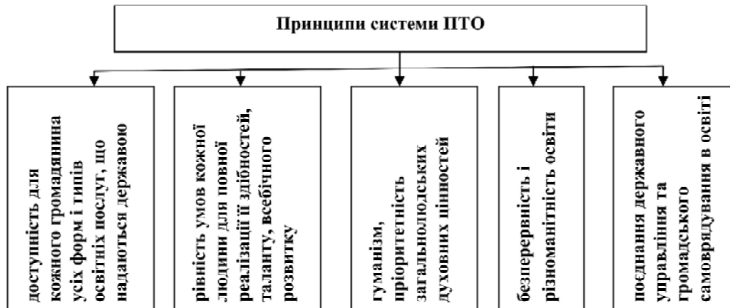
Рис. 3. Принципи системи ПТО як детермінанти методології дослідження у галузі науки "Державне управління"

тролейбуса, машиніст крана, оператор газової котельні, налагоджувальник устаткування та ін. Курсова форма навчання здійснюється також для перепідготовки кадрів відповідно до ринку праці, що склався. Після закінчення курсів здобувачам видаються відповідні свідоцтва;