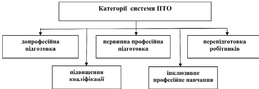
Рис. 1. Категорії системи ПТО як детермінанти методології дослідження у галузі науки "Державне управління"

логічного забезпечення державного управління (професійно-технічною) освітою не набули свого достатнього опрацювання. Обґрунтування методології дослідження державного управління для професійної (професійно-технічної) освіти було здійснено нами у попередній публікації [5]. Тому ця стаття є її логічним продовженням.