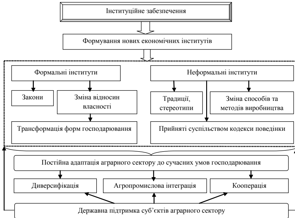
Рис. 2. Система елементів інституційного забезпечення економічної безпеки аграрного сектору