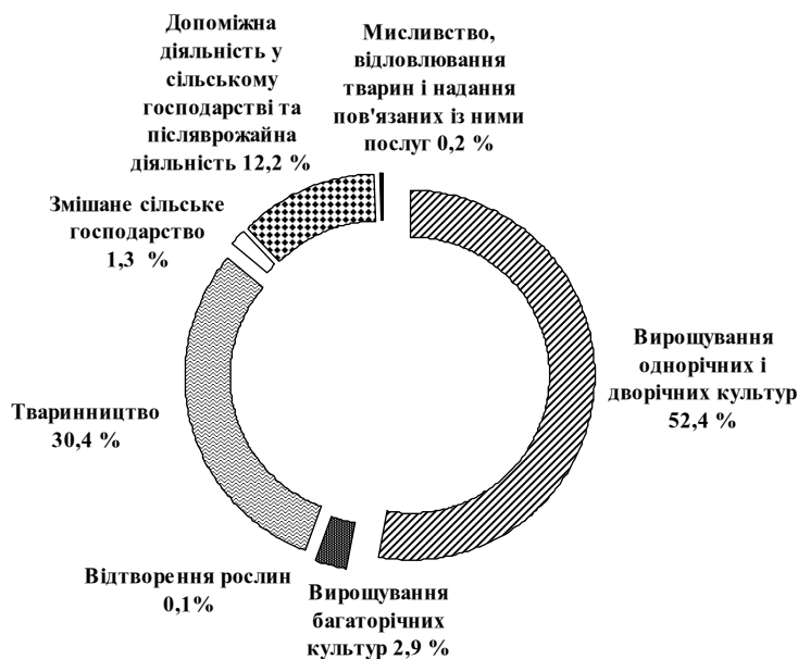
Рис. 2. Розподіл прямих іноземних інвестицій в агросекторі України у 2017 році

Згідно з даними таблиці 2 найбільше іноземних інвестицій в агросектор української економіки надходить з Кіпру — близько 28,6% від загальної кількості інвестицій. Але, якщо аналізувати частку інвестицій в агросектор окремої країни до загальної кількості інвестицій із цієї країни, то лідируючу позицію займає Данія. Майже третина данських інвестицій спрямована в саме в аграрний сектор економіки України. Також вагомими інвесторами є Віргінські острови, Німеччина та Велика Британія.