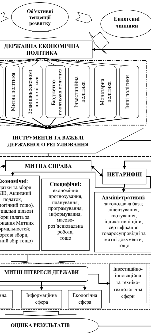
Рис. 2. Управлінський механізм державного впливу у розрізі інструментів та важелів забезпечення митних інтересів

Інструменти державного регулювання, що агреговані в систему регулятивного потенціалу держави згідно групи специфічних важелів мають відповідати за здійснення економічного прогнозування, планування,