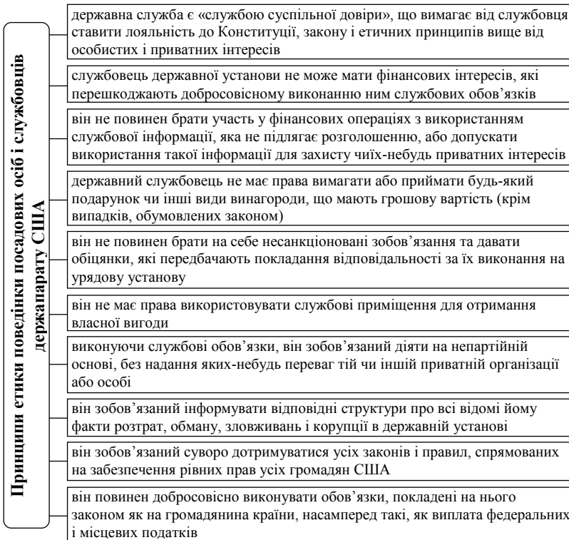
Рис. 1. Принципи етики поведінки посадових осіб і службовців держапарату США