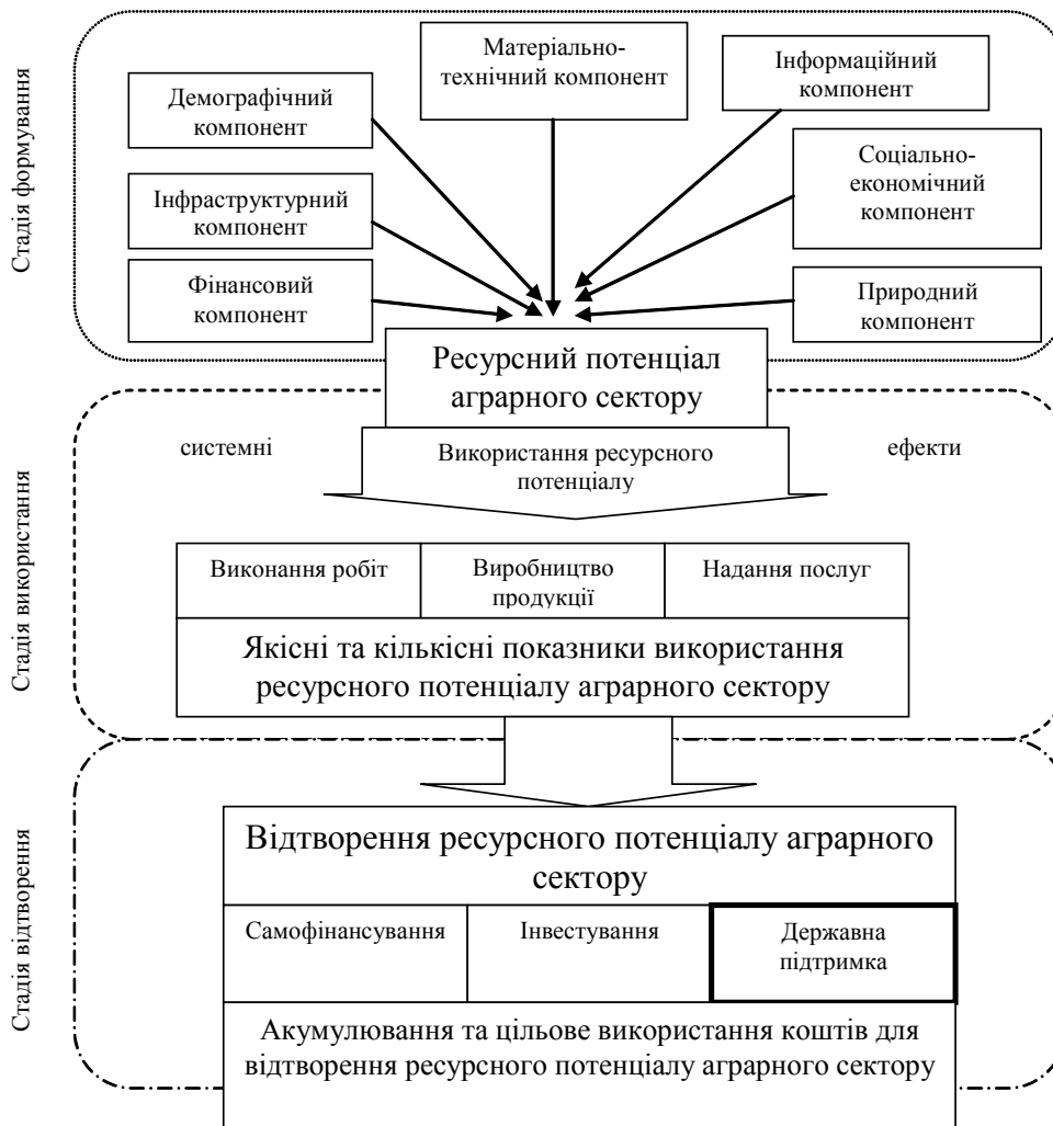
Рис. 1. Системні аспекти формування, використання та відтворення ресурсного потенціалу аграрного сектору

інтеграційних якостей, не властивих її компонентів. Емерджентність є однією з форм прояву діалектичного закону переходу кількісних змін у якісні (про те, що об'єднання елементів створює нову якість, людство знало давно, ще з часів Аристотеля). З цієї закономірності випливає важливий практичний висновок: неможливо передбачити властивості системи в цілому, розбираючи і аналізуючи її по частинах [2, с. 236].