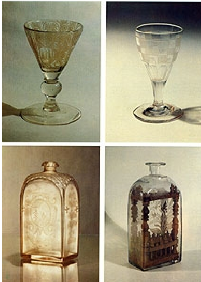
Форми келишків та штофів уріцько-налібоцького скла «білої води» та аметистово-рожевого скла з гравіруванням та розписом олійними та емалевими фарбами. Зібрання Білорусі

Особливістю виробів цих мануфактур були загнуті доверху зовнішні краї стоп ніжок, що утворювали концентричну бганку завширшки 1,5-2 см. Окрім безбарвного скла, названі гуги опанували випуск молочного («фаянсового»), скла «зеленої води» («смарагдового»), а також аметистово-фіолетових відтінків та червоного. Для досягнення червоного тла скляниці початково застосовували накладки з червоної фольги або наносили суцільне криття червоною емаллю. Далі розписували золотом мотивами рослин, пташок, зайців, собак тощо. Інколи застосовували контррельєфне різьблення або оздоблення барельєфними, пластично промодельованими зі скла деталями. Приміром, у вигляді медальйонів-камей, що нагадували вінково-медальйонний тип живопису по кераміці в техніці пат-сюр-пат (маса-на-масу) [5, с. 314].