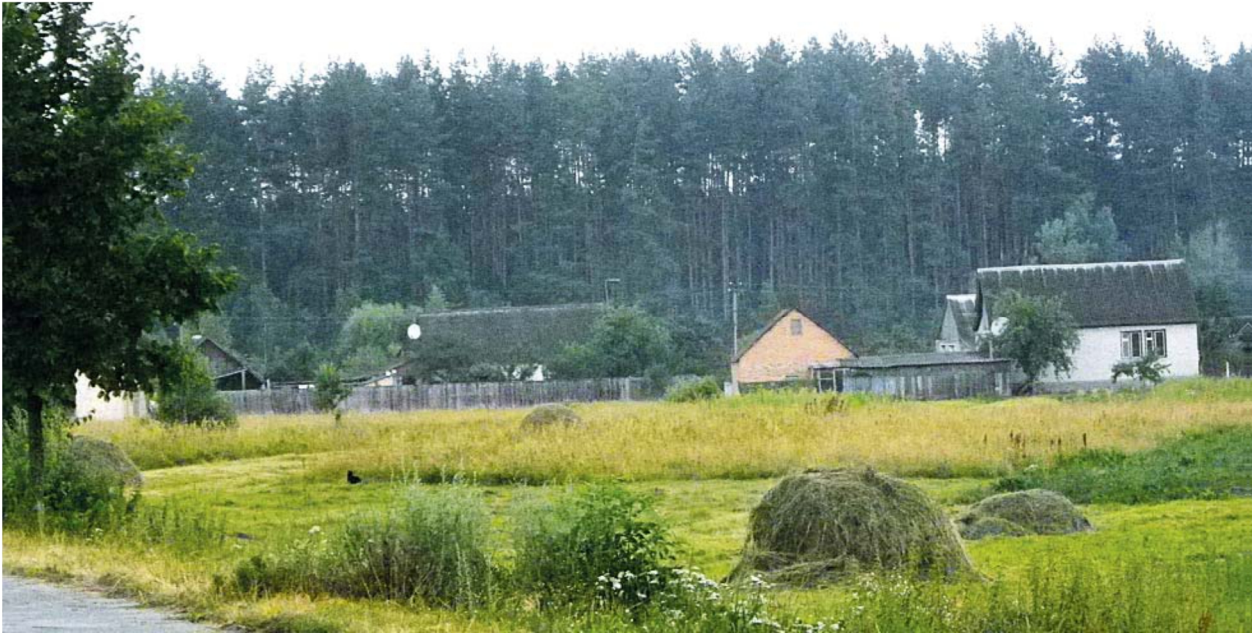
Вигляд місцевості, де колись знаходилася Чуднівська гута. Тепер – Старочуднівська Гута Баранівського району Житомирської області, що межує з Чуднівським районом Житомирської області.

Отже, Радзивілли збагатили промисловість етнічних України та Білорусі, розбудувавши виробництва скла, кристалю і дзеркал у Налібоках, Уріччі, Чуднові. Їх продукція постачалася до Польщі, Росії, інших країн Європи. Безпосередня участь власників у творчо-проектувальних процесах дозволила контролювати художню якість виробів означених підприємств. Окрім того, магнати-промисловці й меценати, представники цього роду дуже уважно ставились до винаймання працівників творчої частини, приділяли значну увагу навчанню місцевого персоналу й таким чином здійснювали певну асиміляцію німецько-чеських і польських технологій з традиціями вітчизняного українського та білоруського мистецтва.