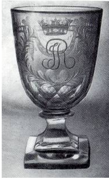
Келишок. Уріччя – Налібоки, початок XIX ст. Зб. Краківського національного музею

Перший занепад виробництва в Уріччі був пов'язаний із шкодою від загарбання французів під час війни 1812 року. Вдруге діяльність підприємства була призупинена по завершенню польського повстання у 1830-х рр., після чого більше відновитися не змогла.