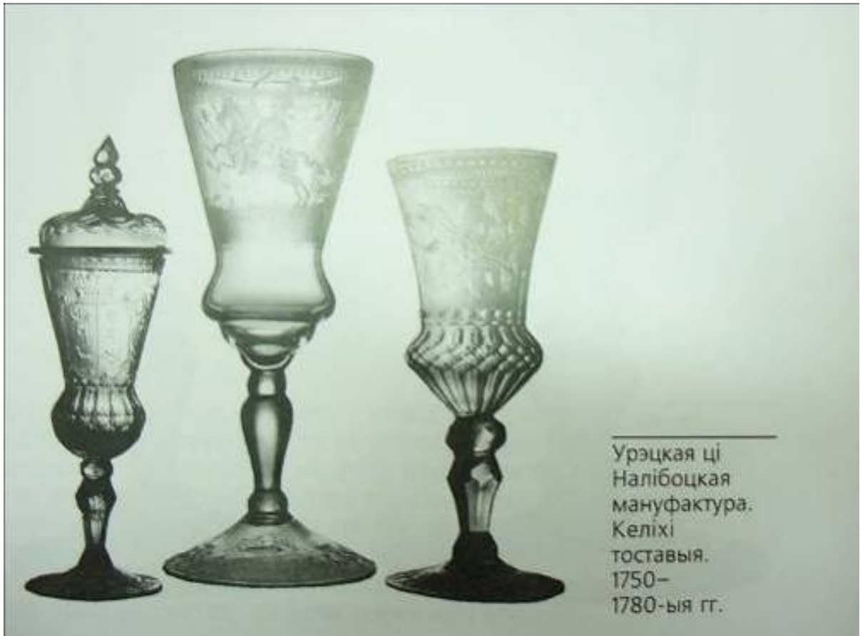
Урэцкая ці Налібоцкая мануфактура. Келіхі тоставыя. 1750– 1780-ыя гг.