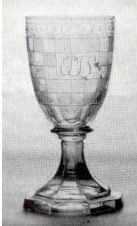
Келишок. Уріччя – Налібоки, кінець XVIII – початок XIX ст.

виробів користувалися 111-ма офортами малюнків в Уріччі та 336-ма в Налібоках. Найбільш поширеними були декори «овес полірований у кратах», «виноградний», пацьорки з гірляндами», «зорячки», «вінки», «шлячки з хвойками», «фестони з вусиками», виноградне листя», «балясики» тощо. В частині з них у візерунку застосовували мотиви бантів із вузькими шнурочками, квіток і букетиків, монограм, шашечок, саксонських вензелів, чеських смуг, ткацьких оздоб «коронкові», ламбрекенів. Від середини XIX ст. до продукції згаданих склярень повертаються елементи класицизму, різноманітні амури тощо [6, с. 148-152].