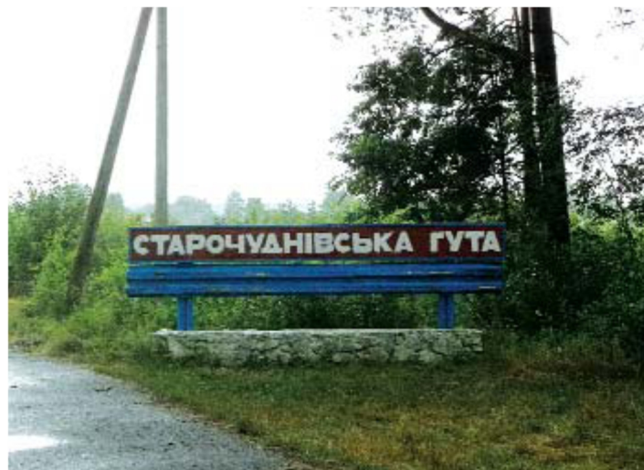
Вказівник до населеного пункту Старочуднівська Гута Баранівського р-ну Житомирської обл.