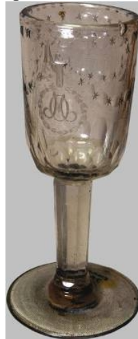
Два кришталеві келихи третьої чверті XVIII ст. так званого «рожевого скла» з Чуднівської (Старочуднівської) Гуту, зб. КНМРМ і МЕХП та їх аналог уріцько-налібоцького аметистового скла, фарбованого оксидом марганцю