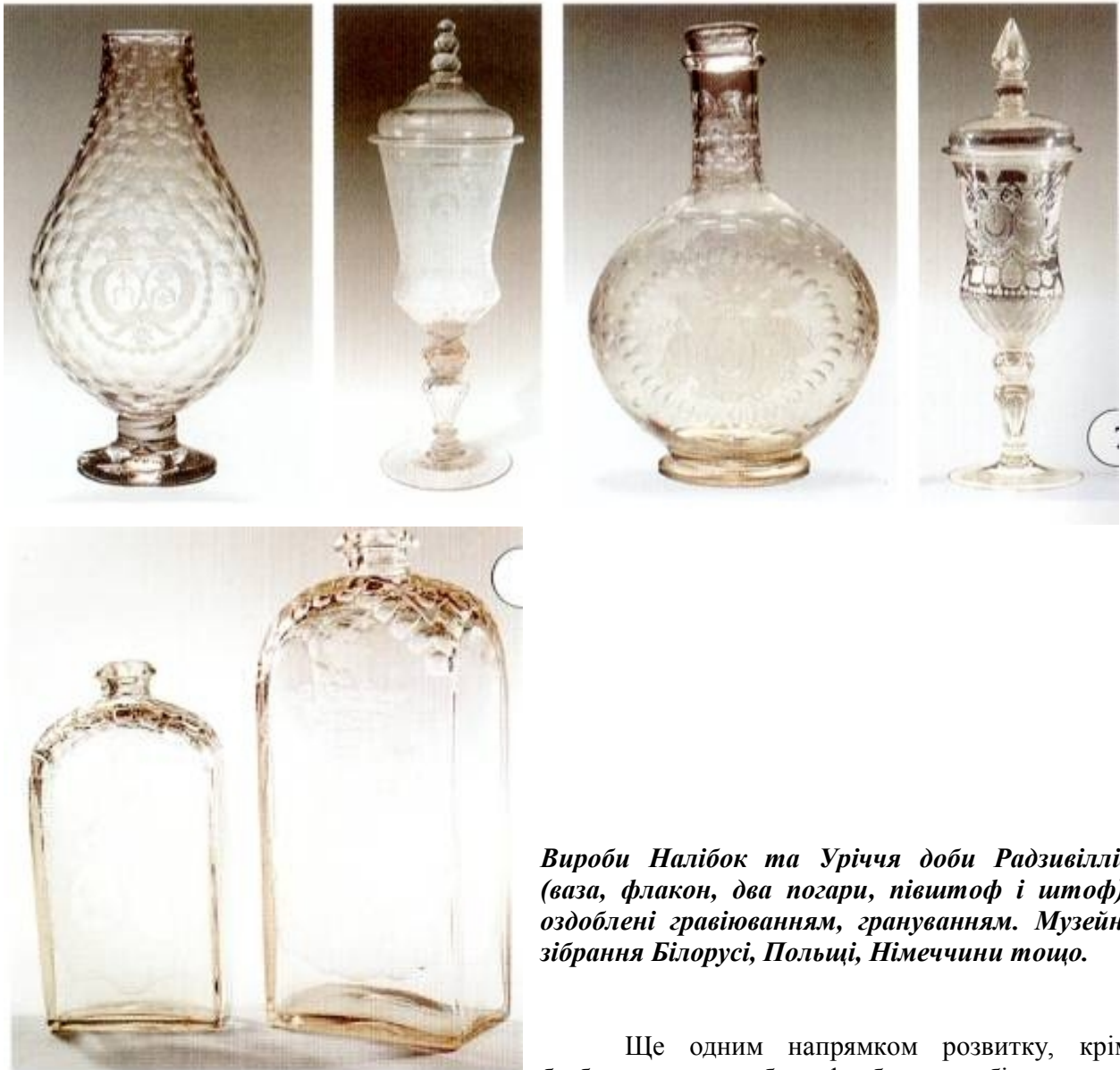
Вироби Налібок та Уріччя доби Радзивіллів (ваза, флакон, два погари, півштоф і штоф), оздоблені гравіюванням, грануванням. Музейні зібрання Білорусі, Польщі, Німеччини тощо.

Ще одним напрямком розвитку, крім безбарвного скла, було фарбоване рубінове скло. Це технологічне ноу-хау, яке варили у Налібоках за складною рецептурою, виготовлялось із додаванням золота, крім того, готові форми ще додатково гравіювали та розписували.