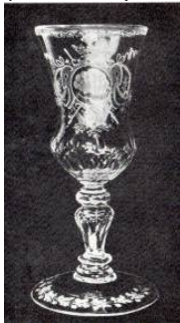
Келих уріцько-налібоцького скла. Друга половина XVIII ст. Зб. Краківського національного музею

З німецькою педантичністю робітникам підприємства дозволялося здійснювати дві перерви по годині на сніданок та обід. Цебто весь робочий день працівників сягав 15 годин, не враховуючи часу, що витрачався на дорогу. Інколи працівники були змушені затримуватися допізна, оскільки виставлялися великі норми виконання обсягів праці. Задля упорядкування їх діяльності при підприємстві утримувався великий гарнізон військових – 25 осіб козаків [2].