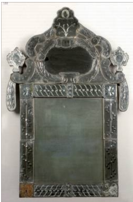
Дзеркало в рамі. Уріччя (?), середина – друга половина XVIII століття. Збірка МЕХП, інв. №°ЕП 14764

З введенням у добу рококо, стилю, що зародився у Франції на початку XVIII століття, дзеркал в оздоблення інтер'єрів, мода на презентативні елементи палацових середовищ (зокрема, кабінетів, зал для балів, прийомів, дзеркальних галерей, анфілад кімнат для відпочинку) набула особливого поширення. В Уріччі плиткам після вирізування надавали потрібного вигляду за допомогою шліфування, полірування, гравіювання, потім вкривали амальгамою, знизу підклеювали папером і монтували на дерев'яну дошку (інколи клеїли). Рідкісні дзеркала в дзеркальних рамах з цього виробництва нині наявні у збірках різних країн, зокрема, України (колекція МЕХП, інв. №°ЕП 14764) [3, с. 236]. Деякі з них за стилістикою тяжіли до традицій давньоруського мистецтва, хоча й були позначені скругленими елементами картушу та відрогів, частково дотичних до барокової культури.