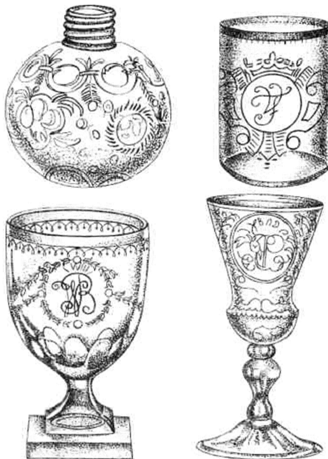
Зразки форм уріцько-налібоцького скла (ваз, склянок, чарок, келихів) та прикладів його оздоблення буквицями, медальйонами, «ложками».

Естафету якості Налібок підхопило й інше виробництво Радзивіллів, започатковане майже одночасно, що знаходилося у центральній частині сучасної Білорусі, нинішня Мінська область, Любанський район. Друге підприємство художнього скла, орієнтоване у першу чергу на випуск дзеркал, було засноване Анною Катажиною в Уріччі Бобруйського повіту біля Слуцька 1737 р. (тепер – селище міського типу, білоруською звучить як «міське селище»). Це виробництво виникло на місці старовинної гуті, закладеної, як свідчить М. Безбородов у «Нарисах з історії склоробства в Росії» (рос. мовою) ще на початку XVII століття, близько 1635 р. [1].