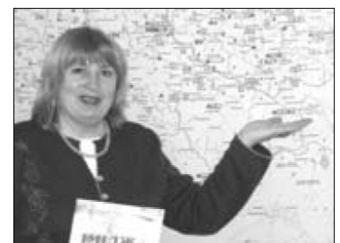
Фото. 1. Головний редактор – Н.І. Білик, кандидат педагогічних наук, доцент, професор кафедри педагогічної майстерності ПОППО