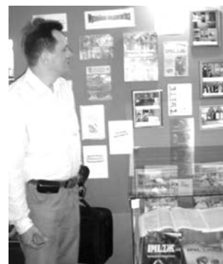
Фото 11. Представлення журналу ІСП на Всеукраїнській виставці «Музейно-педагогічна палітра України», 2009

Зокрема, для системи Полтавської області журналом зроблено, за оцінкою головного редактора, такі важливі речі: лише за 2010–2013 рр. представлений пе-