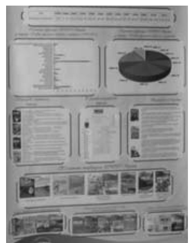
Фото 10. Презентація ІСП на виставці «Іноватика освіти в Україні»