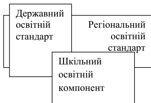
Рис. 2. Структура змісту освіти

глиблення тощо (врахування особистісного запити), об'єктивує профільну спрямованість розвитку особистості, завершуючи задавати стан і характер (профіль, спрямованість) антропотизованої геосистеми як характер антропологізації.