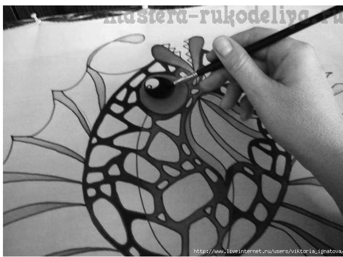
Мал. 4-7. Техніка розпису – холодний батик

– робота над композицією «від плями» на тканині – у писанках це використання контрастних плям;