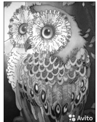
➔ Мал. 1-3. Техніка розпису – гарячий батик