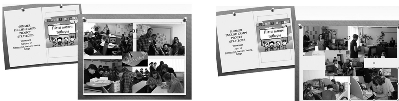
➔ Рис. 4. Участь у тренінгах з англійської мови та методики навчання з метою теоретичного та практичного тренування роботи у проекті

Надалі проект отримав продовження проведенням тренінгу для вчителів англійської мови, які працюють у літніх англомовних таборах і студентів коледжу, які проходили практику у цих таборах із метою формування творчих груп і планування проектів з англійської мови (рис. 4):