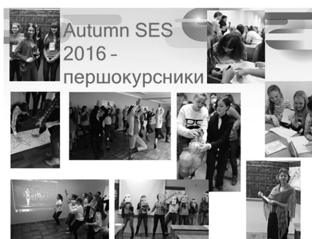
➔ Рис. 7. Сесії англомовної школи

гогічного ВНЗ повинен бути готовий використовувати сучасні технології навчання, що забезпечують високий рівень теоретичної та практичної підготовки учнів, брати участь у розробленні освітніх програм, нести відповідальність за реалізацію їх у повному обсязі відповідно до навчального плану і графіку навчального процесу, створювати базу навчально-методичного оснащення конкретної навчальної дисципліни, формувати в учнів уміння і навички, готувати їх до застосування отриманих знань у практичній діяльності, організувати контроль знань, умінь, навичок, а також самостійну роботу учнів.