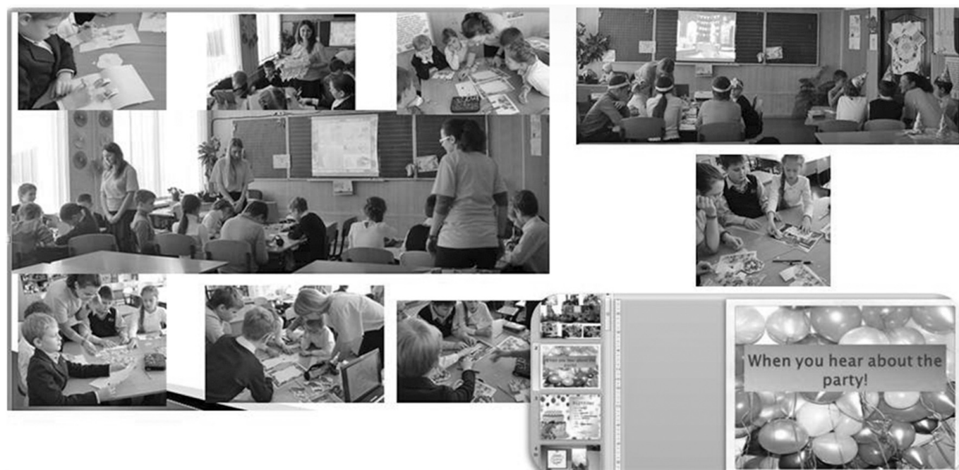
➔ Рис. 3. Практичне проведення занять і розважальних заходів англійською мовою