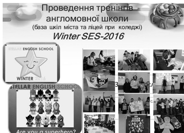
➔ Рис. 6. Проведення тренінгів