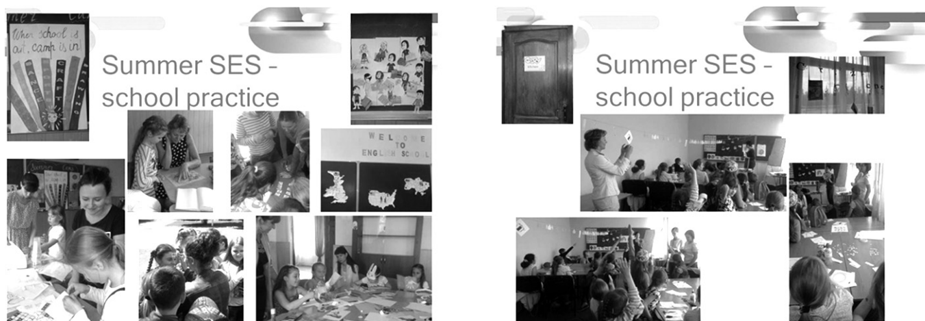
➔ Рис. 5. Практика у літніх англомовних таборах

Результатом став взаємний обмін проектами та подальша реалізація їх на базі шкіл №№ 4, 5, 19, 20, 25 у червні 2016 р. (рис. 5):