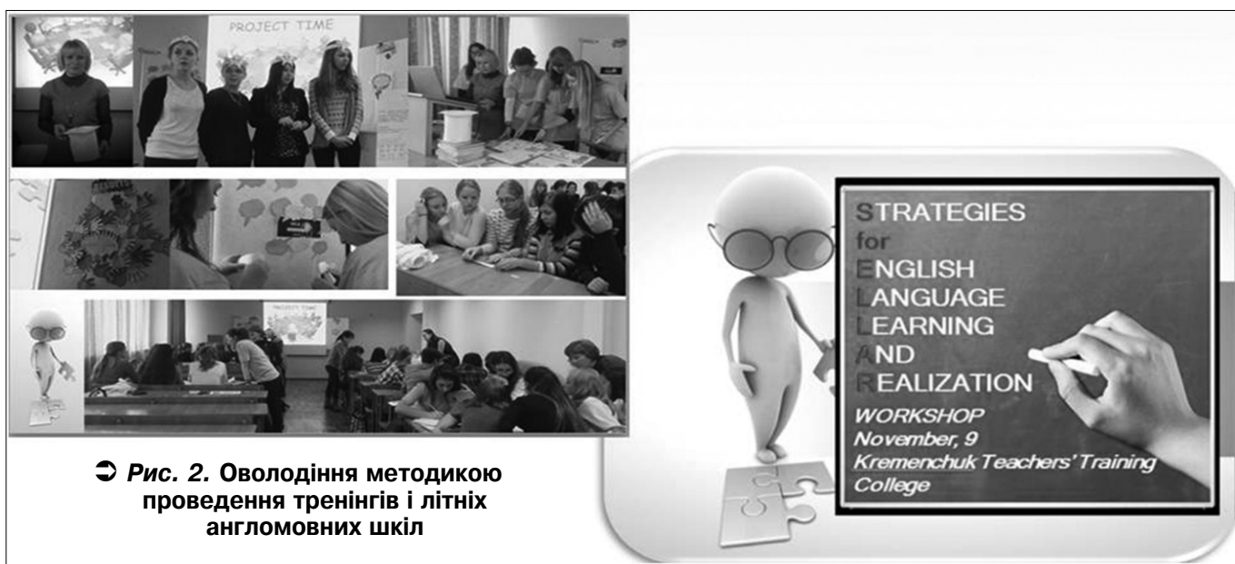
➔ Рис. 2. Оволодіння методикою проведення тренінгів і літніх англomовних шкіл

Спочатку SES функціонувала як активна креативна менторська команда на платформі клубу соціальних проєктів, проводячи тренінги та реалізуючи різні типи проєктів. Потім трансформувалась в англomовну канікулярну школу та гурток за професійним спрямуванням, розширюючи напрямки своєї діяльності. Вони власне у SES змінювались, доповнювались і є очевидними на сьогодні: стимулювати зацікавленість до вивчення англійської мови та підтримувати обдарованих дітей через участь у серії тренінгів і розважальних заходів, що веде до покращення рівня володіння англійською мовою – з одного боку та професійна підготовка студентів і вчителів через оволодіння методикою проведення тренінгів і літніх англomовних шкіл, участь у тренінгах з англійської мови та методики навчання з метою теоретичного та практичного тренування роботи у проєкті, створення власних проєктів з англійської мови, практичне проведення занять, розважальних заходів і тренінгів англomовної школи. Одним із прикладів може бути – осінній тренінг LEARNING ENGLISH THE STELLAR WAY – STRATEGIES for ENGLISH LANGUAGE LEARNING AND REALIZATION для студентів груп 2–3 курсів, який був проведений із метою оволодіння методом проєктів для вивчення англійської мови учасниками гуртка у листопаді 2015 р. Передувала цьому значна підготовча робота з методики проведення тренінгів і проєктів (рис. 2). Практичне володіння англійською мовою (рис. 3)