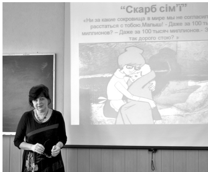
➔ Фото 4. Майстер-клас «Психологічне забезпечення сімей, які виховують дитину з психофізичними особливостями»

Учасники майстер-класу (11 осіб) мали можливість долучитися до самоаналізу та рефлексії, отримати роздаткові навчальні матеріали.