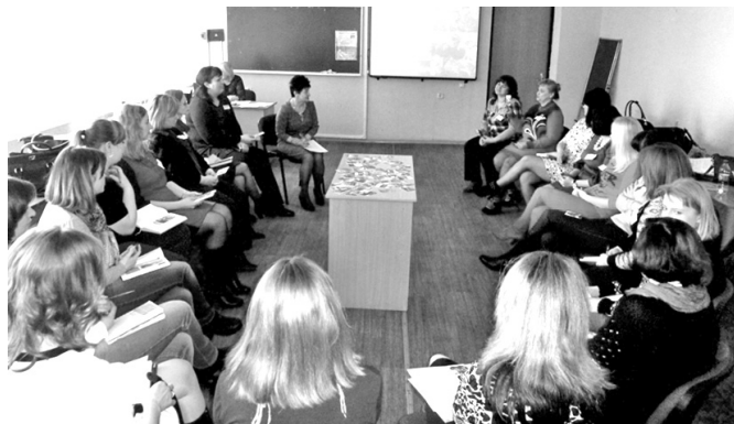
☞ Фото 8. Майстер-клас «Використання метафоричних асоціативних карт «Дерево як образ людини» в груповій та індивідуальній роботі з учасниками навчально-виховного процесу»