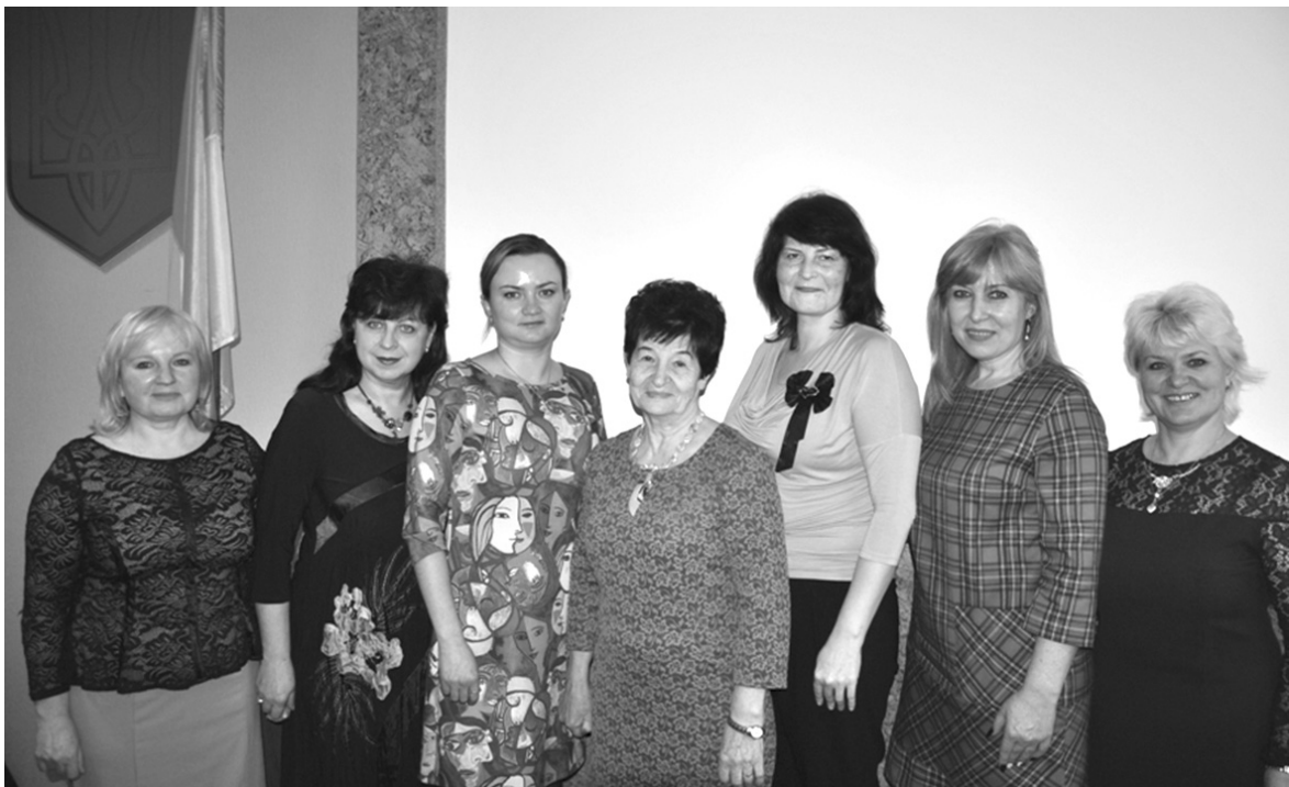
➔ Фото 1. Майстри психологічної служби Полтавщини, 2017

Презентували свою професійну майстерність 7 фахівців (фото 1) психологічної служби Полтавської області, котрі атестувалися у 2016–2017 н. р., ними були проведені шість майстер-класів для 68 учасників.